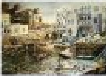
View of the town of Tyndar, Tyndar, Lebanon, 1911

Երբ զննում էի բովանդակության ցանկը, շատ հետաքրքրեց հեղինակի կյանքի լիբանանյան հանգրվանին՝ ծննդավայրին վերաբերող մասում տեղ գտած «Մեր թաղի հերոս կիները» վերնագիրը: Ի՞նչ հերոս կանանց մասին էր խոսքը, որ մենք չգիտենք: Գայթակղությունն այնքան մեծ էր, որ ընթերցանությունը սկսեցի ոչ թե սկզբից՝ սովորության համաձայն, այլ տվյալ հատվածից: