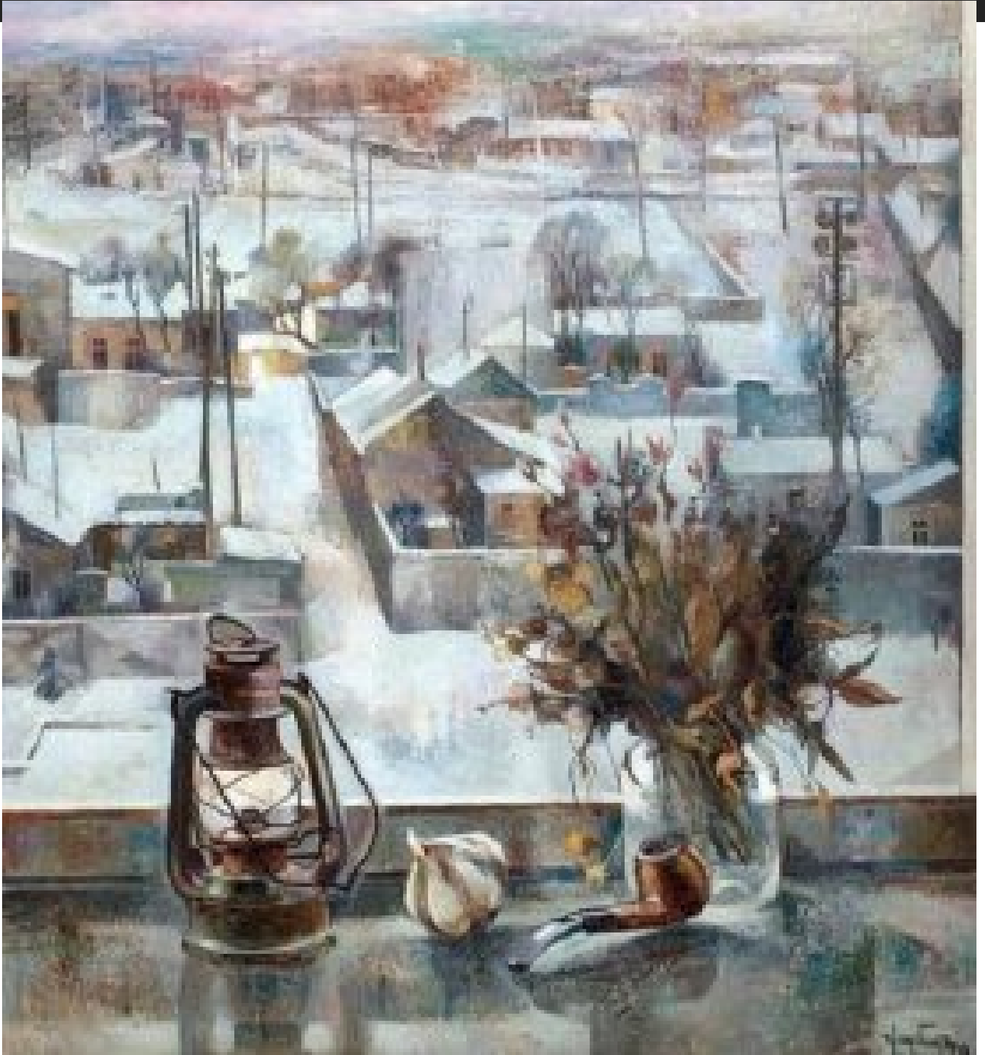
«Իմ պատուհանից» շարքից, 1979

Ստեղծագործական վերընթացի մեկնարկն եղավ 1972-ին, երբ ավարտեց Երևանի գեղարվեստա-թատերական ինստիտուտը: Աշակերտելով Երվանդ Քոչարին՝