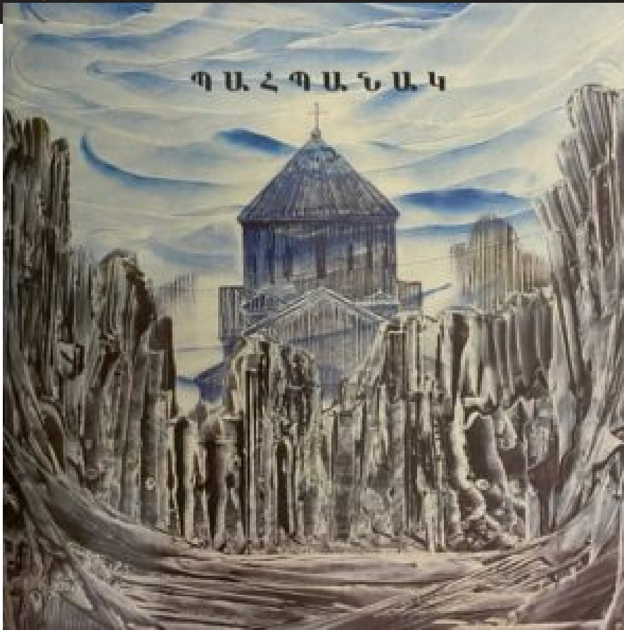
Արթիլիաս, 1989, Աշուն

Այդ օրերուն ես՝ տնանկի կարգավիճակի մէջ՝ կաթողիկոսարան կ'ապրէի, ուր կը պաշտօնավարէի թէ՛ «Մարտիկեան» վարժարանէն ներս եւ թէ՛ դպրեվանքը : Գարեգին Բ. Վեհափառի հետ շաբաթը անգամ մը կը բարձրանայի Պիքֆայայի վանքը, ու ճանապարհին կը հաղորդակցէինք Սուէտիոյ (Մուսալերան ու Քեսապի) մեր բարբառներով... : Պաշտօնականութենէ դուրս՝ Վեհափառը կենսալից ու կատակասեր բնաւորութեան տեր հաճելի գրուցակից էր: