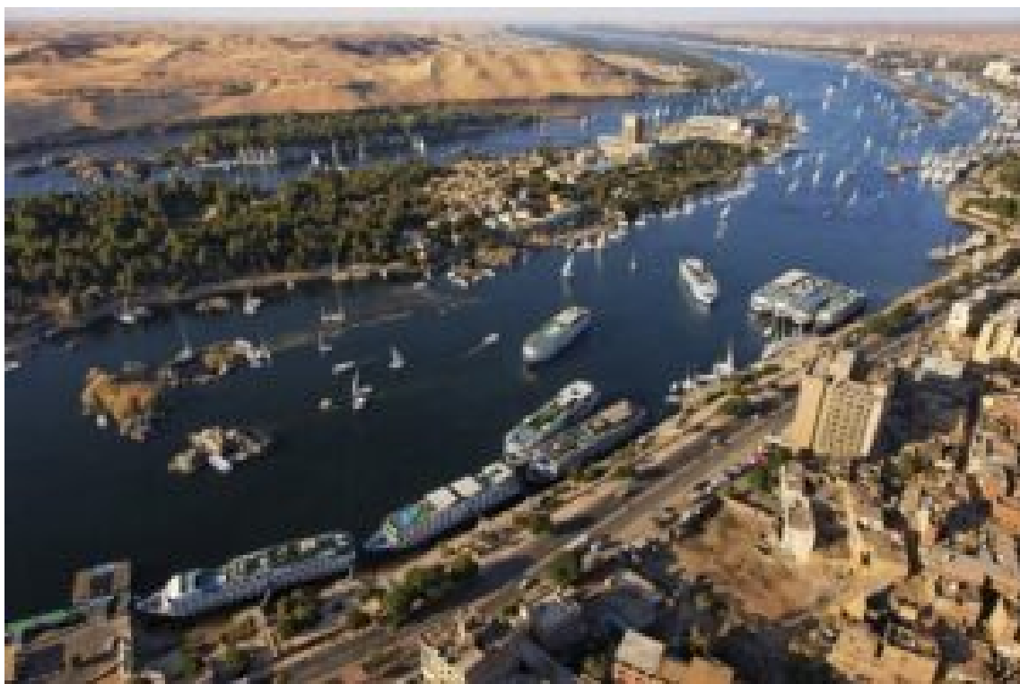
View from the east bank of the Nile, looking north (down river) towards Elephantine Island.

Նմոյշ: Սակայն մենք իբրև ազգ ցրուած ու վտանգուած ենք, այնպէս ինչպէս դուք՝ հայերդ: