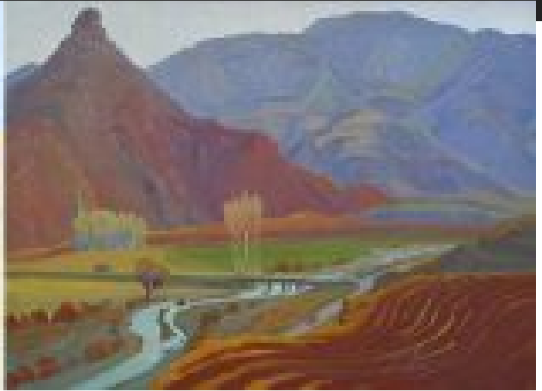
Միսիան, Արփա գետը

«Մինասյանը ուզում էր հեռու ապրել մարդկանցից, բայց մերձեցավ նրանց իր նկարներով: Ժամանակին 60 աշխատանք ընտրեցի եւ ցուցադրեցի Փարիզում իմ հիմնած մշակութային կենտրոնում: Երկու օրվա ընթացքին շուրջ 600 այցելու եկավ և կտավների մեջ տեսավ, թե ո՞ր երկիրն է Աստվածաշնչյան Արարատի Հայաստանը, ի՞նչ խոր անդորրություն կա նրա բնապատկերներում: Եւ նկարիչը որքան ուզում է հեռու ապրել մարդկանցից, դեպի կյանք է վերադառնում իր իսկ վրձնած մթնոլորտի մեջ»: Հարություն վրդ. Պգտիկյան, Մխիթարյան միաբան