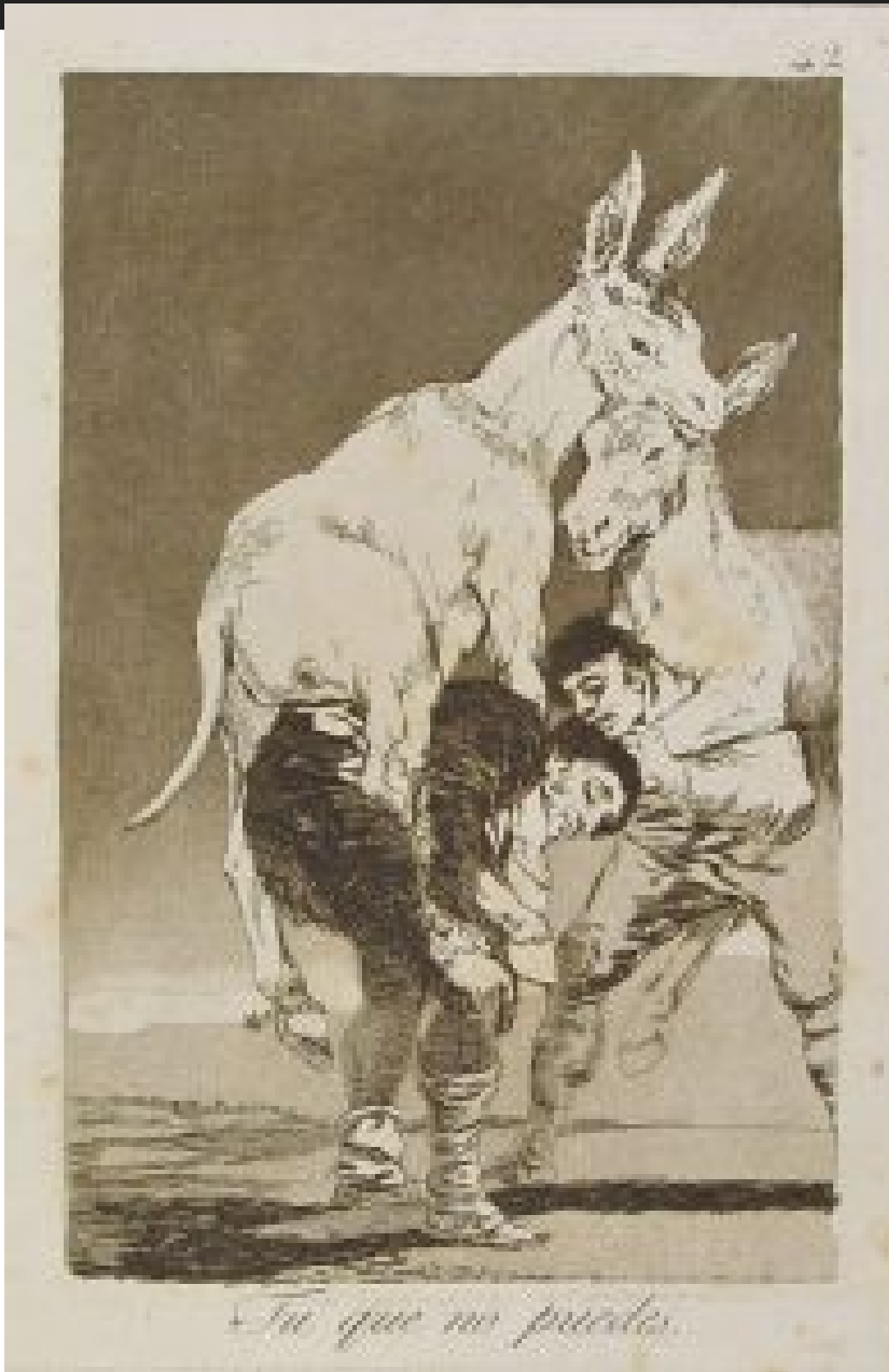
«Դու որ անճարակ ես»