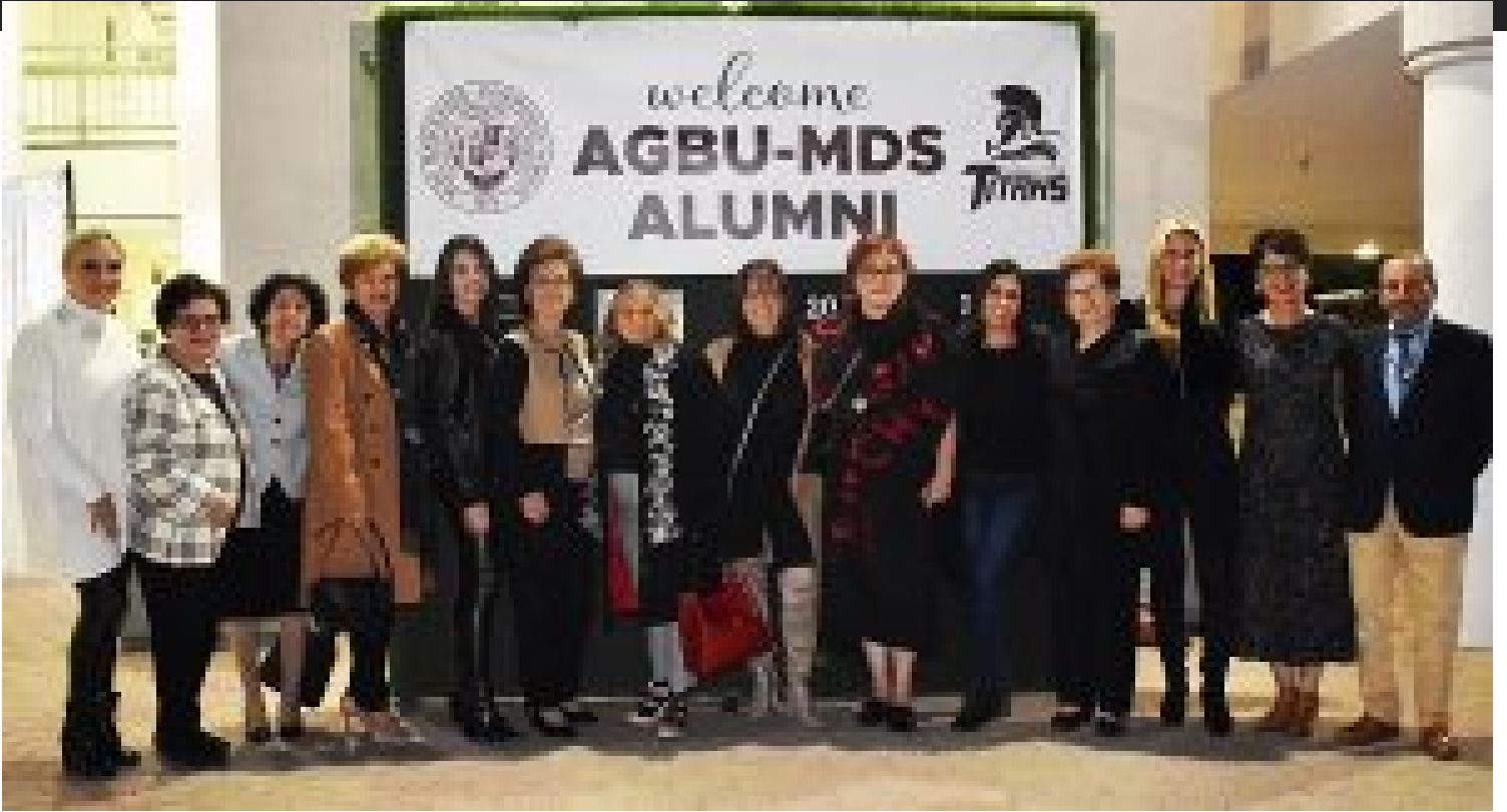
Նախկին և ընթացիկ ուսուցիչներ