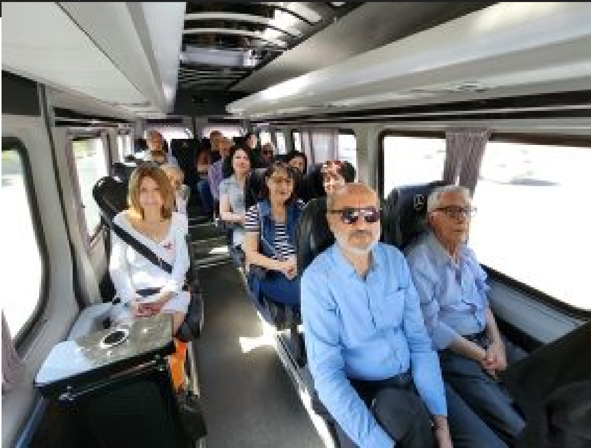
Ասպետ եւ Այտա